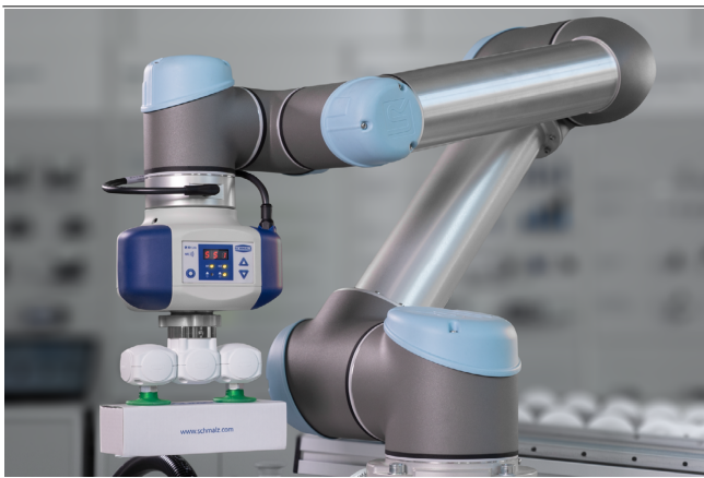
Elektrischer Vakuum-Erzeuger ECBPi bei der Handhabung von Kartons